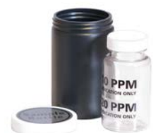
Ampolla di test inclusa