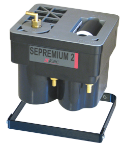
Staffa di supporto

Tel +31 45 5242427 info@jorc.nl www.jorc.eu