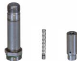
Gruppo valvola ad azione diretta di JORC: l'affidabilità

JORC è certificato NEN - EN - ISO 9001:2015