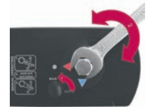
停電時、バルブの手動開閉可能