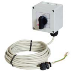
リモートコントローラーの付属品