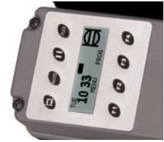
LCDディスプレイを持つクォーツ制御タイマー搭載