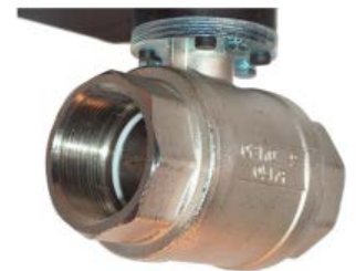
ニッケルメッキ黄銅とステンレスのボール