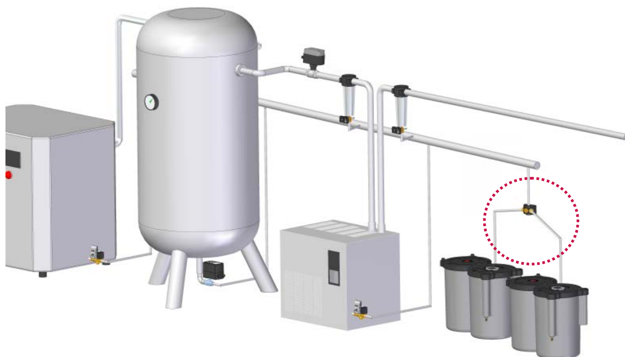
Una tipica installazione del PURO-CT-DISTRIBUTOR