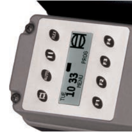
Quartzgestuurde timer met LCD-display