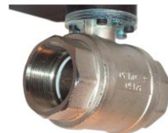
Ventiel van vernikkeld messing

JORC is NEN - EN - ISO 9001:2015 gecertificeerd