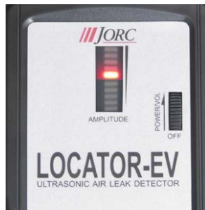
Görsel kaçak göstergesi