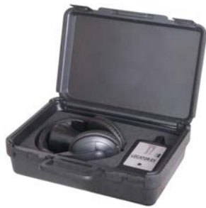
Kendi çantasında, gerekli tüm aksesuarları ile birlikte tedarik edilir.