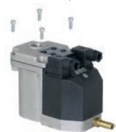
1. Dévissez les 4 boulons