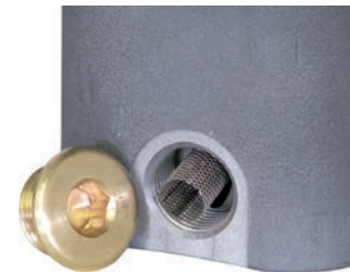
Crépine de protection intégrée pour protéger la vanne.