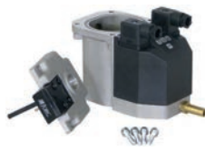
2. Retirez la partie supérieure