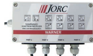
The SMART GUARD-HP peut être connecté au JORC WARNER (consultez-nous pour plus d'information)