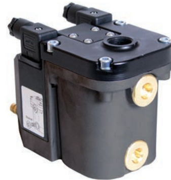
Options d'entrée multiple (3)