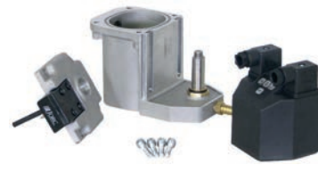
3. Retirez la partie électronique