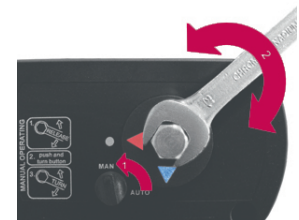
Im Fall eines Stromausfalles ist es möglich da Ventil manuell zu öffnen und zu schließen