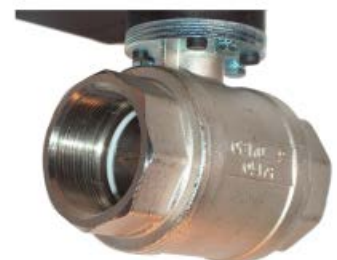
Ventil aus Messinglegierung