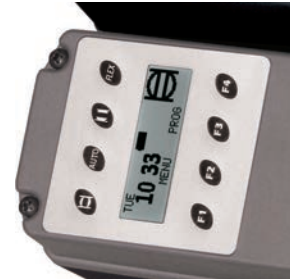
Eingebauter Quarz gesteuerter Taktgeber mit LCD-anzeige