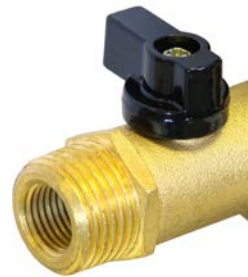
Entrada doble (1/2" & 1/4") para flexibilidad de instalación