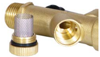
Vanne à bille et tamis intégrés