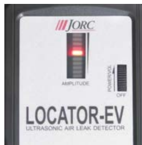
視覚的な空気漏れと電池残量の表示