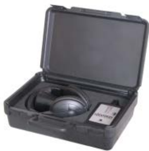
保護ケース付き。ヘッドセットと焦点探触子入り