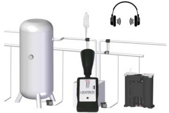
可聴と視覚的な漏れの表示