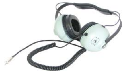
防音ヘッドセット~追加オプションあり