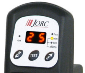
Цифровой дисплей D-LUX