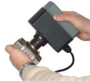
Ouverture et fermeture de la vanne manuelle possible, en cas de panne de courant électrique