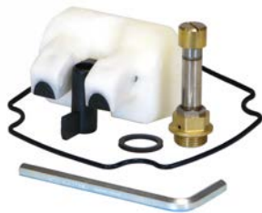
Service kit verfügbar