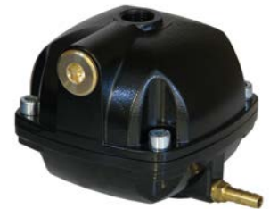
Mit Einlässen oben und seitlich ausgestattet