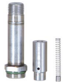
L'ensemble de la vanne pilotée direct, vous offrant de la fiabilité

JORC est certifié NEN - EN - ISO 9001:2015