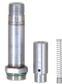
JORC válvula de acción directa con sello de FPM