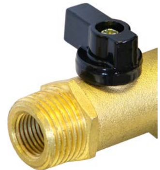
Двойной вход 1/2" / 1/4"